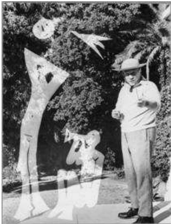
André Villers et Pablo Picasso, Picasso dans le jardin de La Californie avec découpage de Picasso en surimpression Cannes, villa La Californie, 1961

Musée national Picasso – Paris, Documentation © André Villers © Succession Picasso, 2013