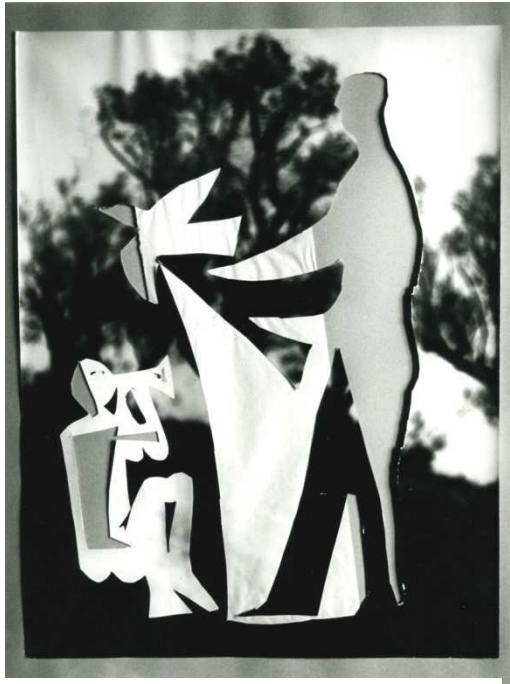
André Villers Découpage de Picasso : L'homme à l'oiseau Cannes-Vallauris, 1954-1961 Tirage gélatino-argentique Collection privée