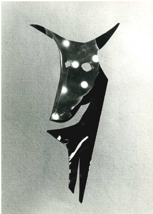
André Villers Découpage de Picasso : Tête Cannes-Vallauris, 1954-1961 Tirage gélatino-argentique Collection privée