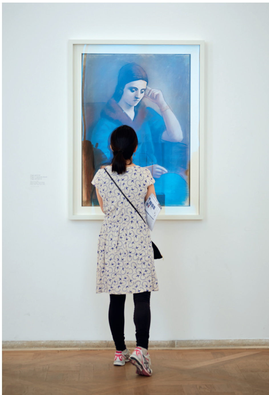
© Succession Picasso, 2014

Nous vous conseillons de bien définir vos objectifs: qu'attendez-vous de cette visite? Souhaitez-vous qu'elle soit un moment d'apprentissage, de convivialité, de détente? Voulez-vous surtout que les participants fassent preuve d'autonomie?