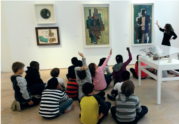
Une visite au musée Picasso © Succession Picasso, 2014 © Musée national Picasso-Paris, 2014