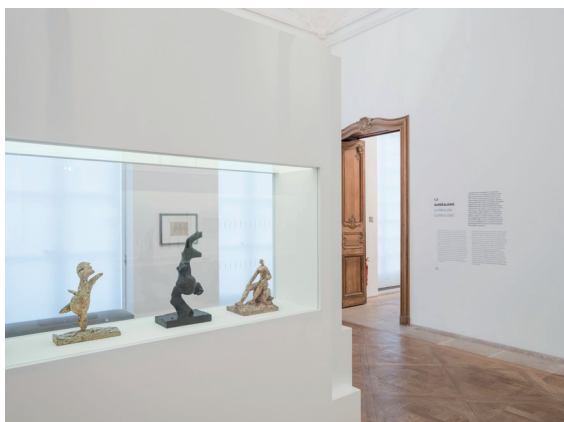
Un événement jeune public au musée Picasso (2017)