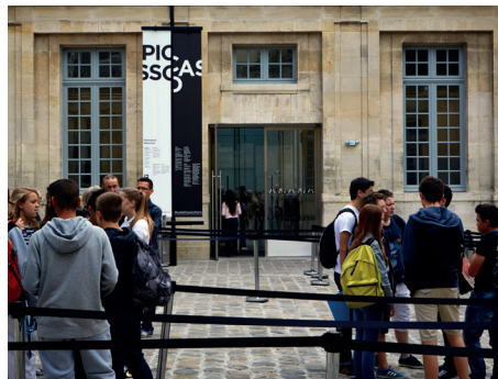
L'entrée du musée Picasso

Vous aurez alors tous les éléments en main pour venir visiter le musée avec votre groupe.