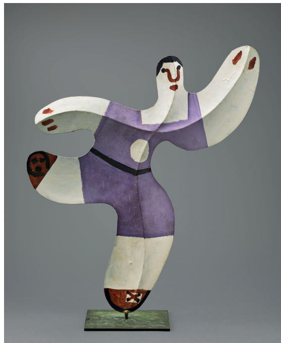
Pablo Picasso Footballeur Cannes, printemps 1961 Tôle découpée, pliée et peinte, 58 x 49 x 14 cm © Succession Picasso, 2015

Au cours de sa carrière, Picasso déconstruit les catégories artistiques traditionnelles: les peintures prennent du relief et quittent la bi-dimensionnalité, les sculptures s'inspirent de dessins ou, comme ici, de petites maquettes en papier découpé et plié. Les échanges entre les différentes techniques artistiques sont incessants et passent souvent de la 2D à la 3D, et vice-versa. Pour concrétiser ses travaux de sculpture, Picasso doit régulièrement faire appel à des artisans spécialisés. Ce Footballeur, d'abord conçu en papier et en petit format, a ensuite été transposé en tôle et agrandi par deux artisans de Vallauris, Tobias Jellinek et Joseph-Marius Tiola.