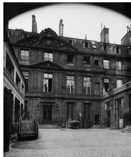
L'hôtel Salé, alors appelé « Le Camus » dans le plan de Turgot (vers 1739)