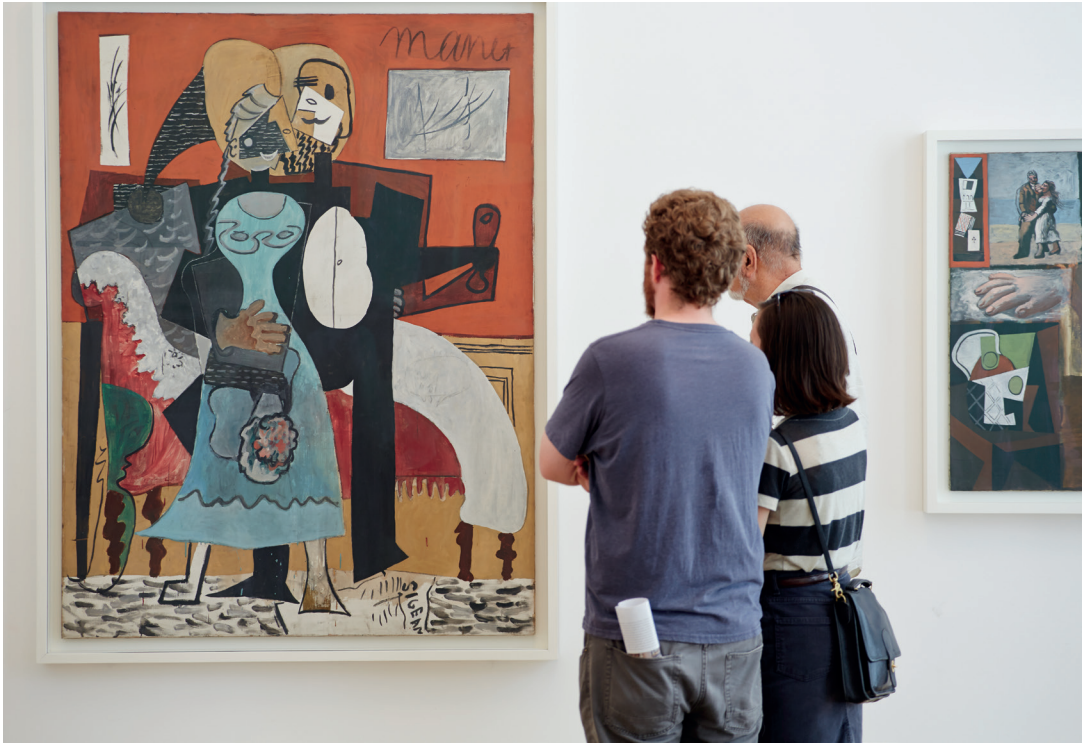
© Succession Picasso, 2014