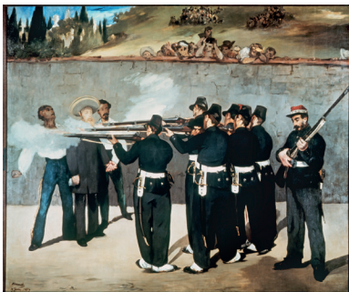
Pablo Picasso Massacre en Corée Vallauris, 18 janvier 1951 Huile sur toile, 110 x 210 cm © Succession Picasso, 2015

Massacre en Corée s'inscrit dans la lignée d'une représentation traditionnelle de la guerre: la peinture de cruauté. Mais en examinant l'œuvre de près, on se rend compte qu'il n'y a aucun indice permettant d'identifier le conflit représenté. L'œuvre prend une dimension universelle qui fait toute sa force. Ici aussi, il faut prendre en compte le rôle de la photographie. À partir de la guerre civile d'Espagne (1936-1939), les conflits armés font l'objet d'une couverture photographique intense, avec laquelle la peinture ne peut rivaliser, ni en termes de réalisme ni en vitesse d'exécution. Peindre la guerre ne peut plus se limiter à la représenter: l'artiste doit se repositionner, ce qui constitue un véritable défi!