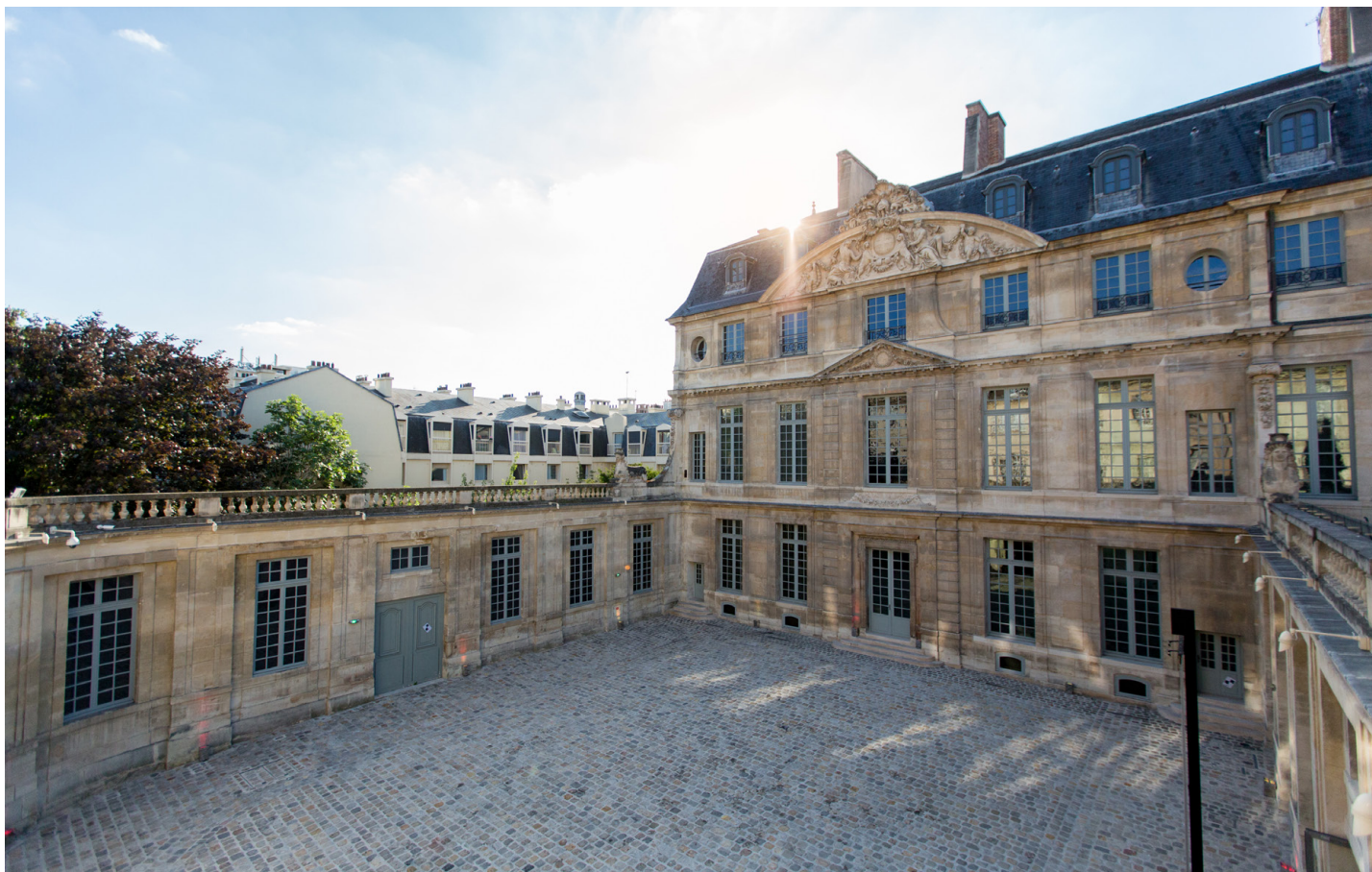
Façade de l'Hôtel Salé — Musée national Picasso-Paris