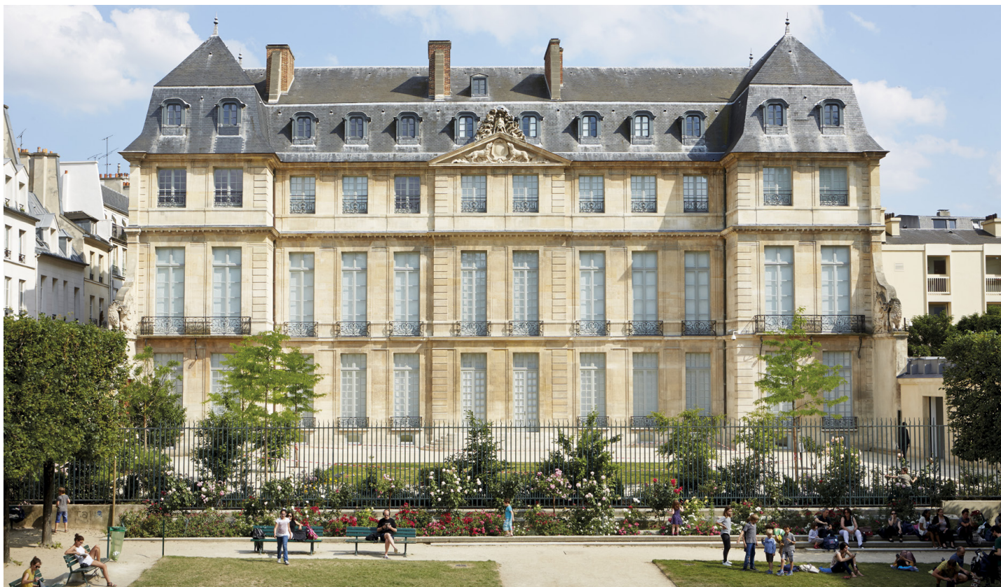
Façade jardin de l'Hôtel Salé — Musée national Picasso-Paris